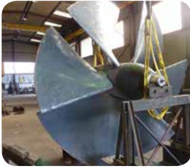
▷ Turbine Kaplan en cours de rénovation

De par son expérience et pour éviter des dépenses importantes de génie civil et de matériel, l'acquéreur du site a fait le choix de conserver le principe hydraulique en place. Si la conservation des turbines existantes a été possible (après démontage et réparation des pales et distributrices attaquées par la rouille suite à 30 ans d'inactivité), tout le système électrique a été remplacé. Deux équipements neufs ont donc été installés avec, pour chaque turbine, un multiplicateur et une génératrice triphasée asynchrone de 250 kW. L'investissement dans un système à basse vitesse, plus performant, a été écarté par