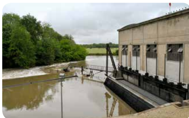
▷ Vue d'ensemble de la centrale après travaux

Puissance installée : 380 kW Hauteur de chute nette : 1,90 m Production attendue : 2 000 000 kWh/an