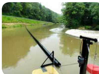
▷ Canal d'amenée et retenue sur la Saône en amont de la centrale