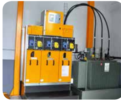
▷ Le transformateur et son système de sécurité

Grâce à la réhabilitation du site et au remplacement du barrage à aiguilles (en très mauvais état et rarement réglé) par un système de clapets hydrauliques automatisés, la régulation et le contrôle du niveau d'eau sont devenus opérationnels. N'habitait pas sur place, l'exploitant a aussi installé une télé-surveillance du site, un système de supervision et de contrôle à distance de la centrale.