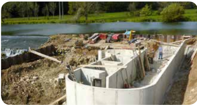
▷ Construction de la passe à poissons

Le tronçon de la Saône sur lequel se situe la centrale est classé en liste 1 (réservoir biologique à restaurer) et l'IPR (Indice poisson rivière) est de qualité « mauvaise » à « très mauvaise ». Les travaux de rénovation de la centrale et des canaux d'amenée et de fuite ainsi que la mise en place d'une passe à poissons ont été les bienvenus et ont permis de rétablir une libre circulation piscicole sur 13,8 km.