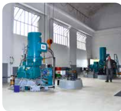
▷ Salle des machines (générateurs au-dessus des turbines)